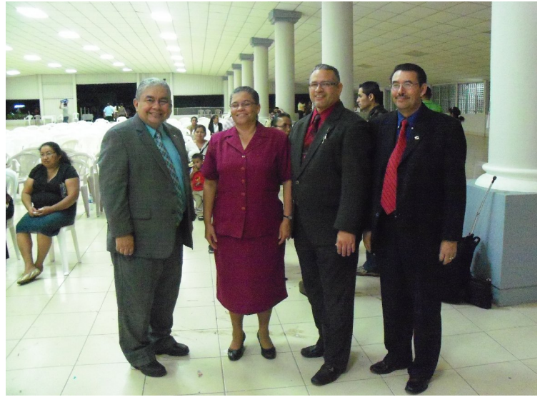
• • COSTA RICA ADORANDO